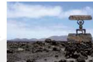
PARQUE NATURAL DE TIMANFAYA