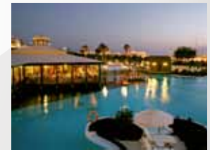
HOTEL VOLCÁN LANZAROTE